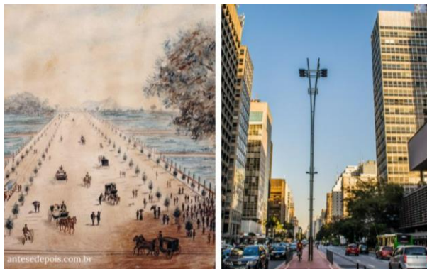
Avenida Paulista.

Analise as imagens e leia o texto para responder à questão.