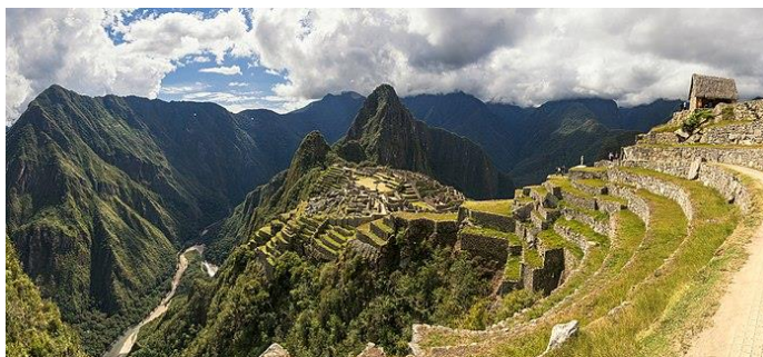
Machu Picchu em meio às cadeias de montanhas peruanas.

Observe a imagem a seguir para responder à questão.